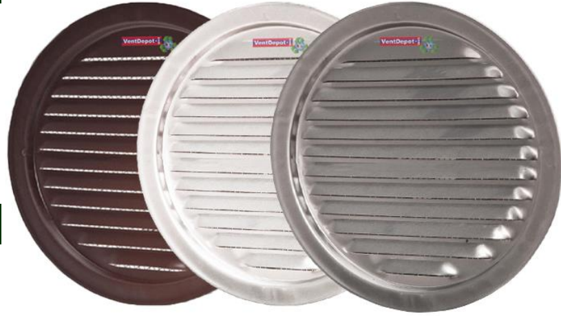
Características Técnicas Específicas de Rejillas para Aire o Rejillas de Paso de Aire, AlumRound.

El AlumRound VentDepot cuenta con un año de garantía sujeto a cláusulas.