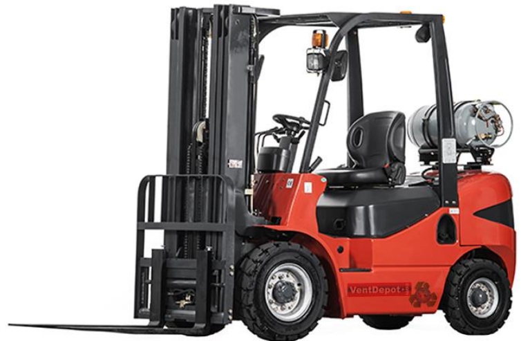
Características Técnicas Específicas de los Montacargas, BurKlift.

El BurKlift cuenta con 1 año de garantía sujeto a cláusulas de VentDepot.