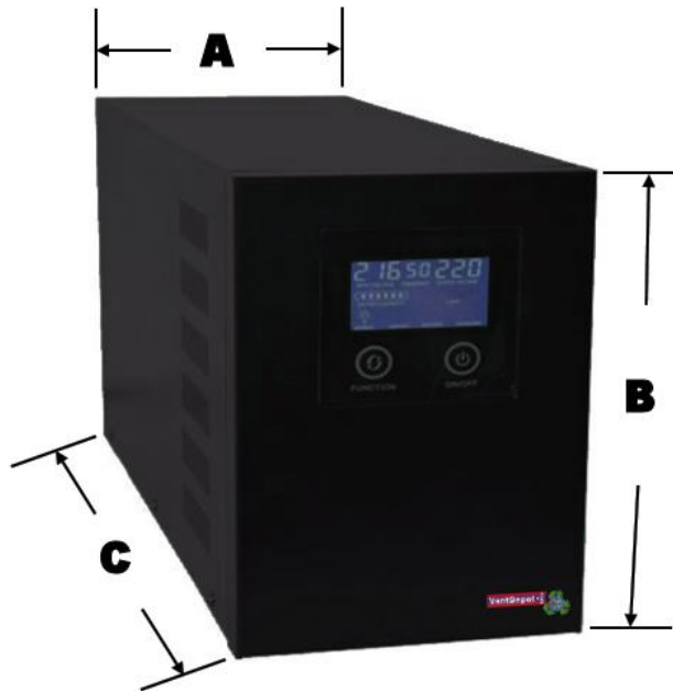
Sistema Off Grid Generación Eléctrica, GoodKit.