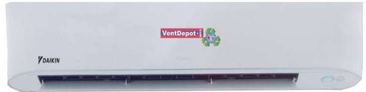
Características Técnicas Específicas del Aire Acondicionado MiniSplit, InverSplit