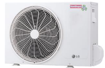
Características Técnicas Específicas del Aire Acondicionado, SaveEnergy.