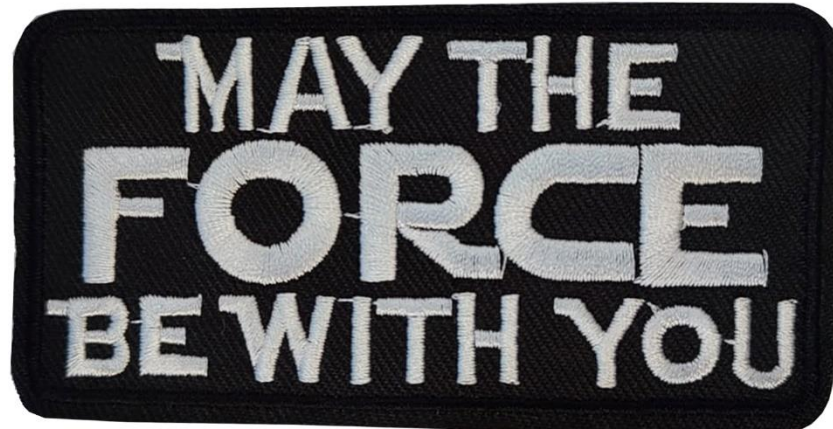
Características Técnicas Específicas del Parche: TacticWords06.

El Parche TacticWords06, cuenta con garantía sujeta a cláusulas PatchPros.