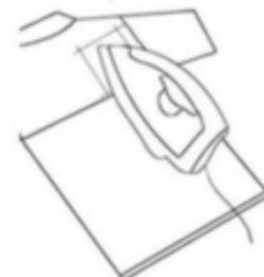
Planchar detras de la prenda debajo del parche 30"