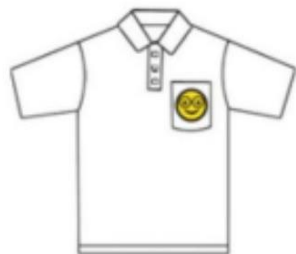
Coloque parches en su paño. (Bordado lateral hacia arriba)