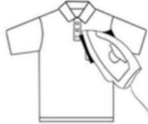
Plancha sobre parche en alto durante unos 30 segundos