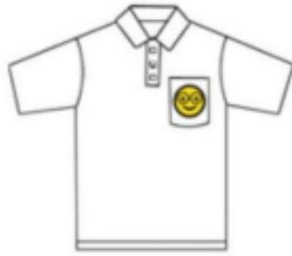
Coloque parches en su paño. (Bordado lateral hacia arriba)