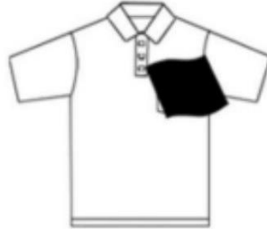
Coloque la tela de algodón sobre el parche