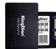
SSD 2.5" SATA Solid State Drive