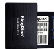
SSD 2.5" SATA Solid State Drive