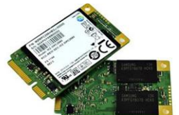
SSD MSATA Solid State Drive