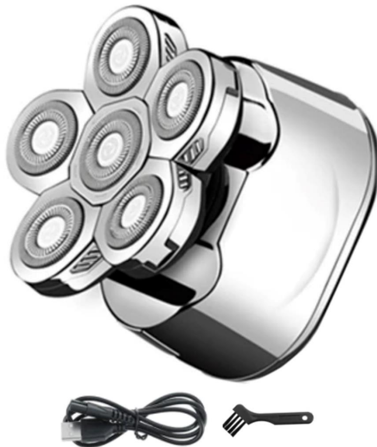
Características Técnicas Específicas de la Navaja Profesional para Barba, RazorMach.

El RazorMach, cuenta con 1 año de garantía sujeto a cláusulas High Mónaco.