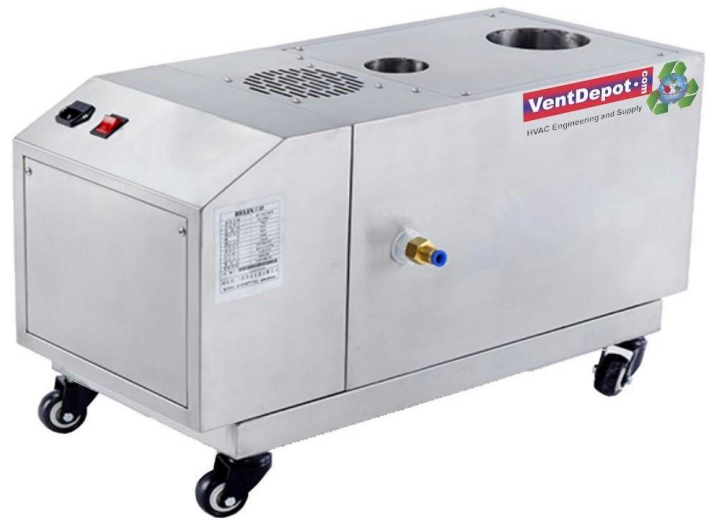
Características Técnicas Especificas del Humidificador ultrasónico, CloudMini

El CloudMini cuenta con un año de garantía sujeto a cláusulas de VentDepot.