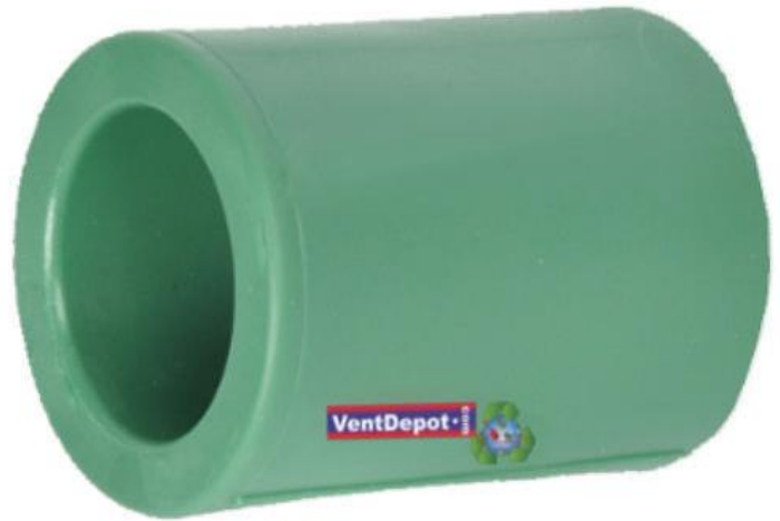
Características Técnicas Específicas del Cople Tipo Pesado PVC, CopleHeavy

El Cople Tipo Pesado de PVC, CopleHeavy tiene una garantía de un año, certificado por escrito, sujeto a cláusulas de garantía VentDepot.