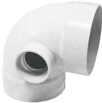
SanixCodo 90° Multex con Salida Lateral.