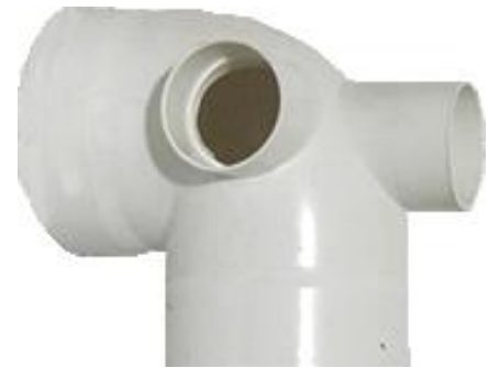
SanixCodo 90° Multex con Salida Lateral y/o Trasera.