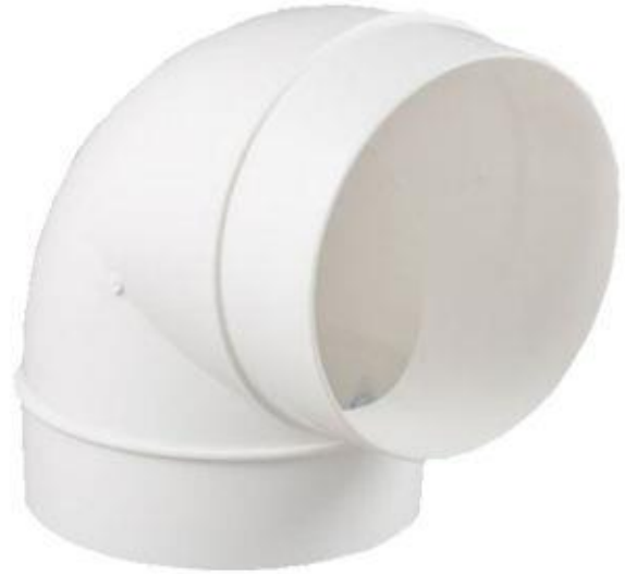
Características Técnicas Específicas del Codo de 90° de PVC, SanixCodo 90°

El Codo de 90° de PVC, SanixCodo 90° tiene una Garantía de un año, certificado por escrito, sujeto a las cláusulas de garantía VentDepot.