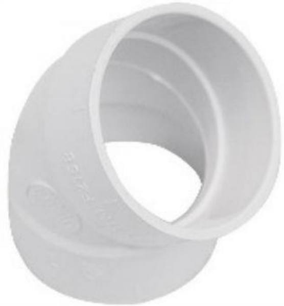
Características Técnicas Específicas del Codo de 45° de PVC, Sanix Codo 45°

El Codo de 45° de PVC, SanixCodo 45° tiene una Garantía de un año, certificado por escrito, sujeto a las cláusulas de garantía VentDepot.