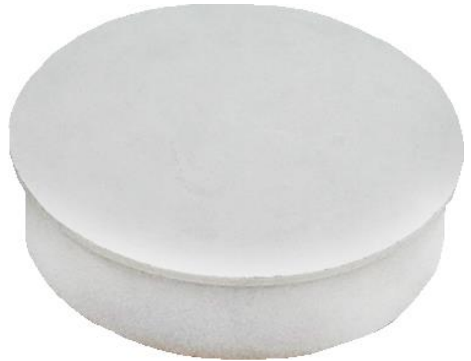
Características Técnicas Específicas de la Tapa de Inserción de PVC, SanixTapa Inserción

La Tapa de Inserción de PVC, SanixTapa Inserción tiene una Garantía de un año, certificado por escrito, sujeto a las cláusulas de garantía VentDepot.