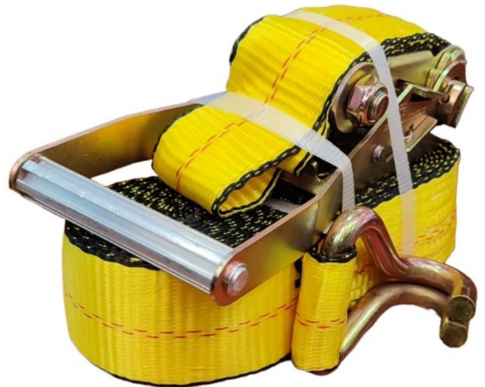
Características Técnicas Específicas del Sujetador con Matraca, LassoMat.

El PlastFuel, garantía por defecto de fabricación sujeto a cláusulas VentDepot.