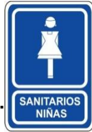
Informativos: Sanitarios Niñas.