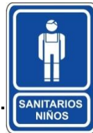
Informativos: Sanitarios Niños.