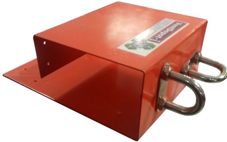
Elemento de seguridad