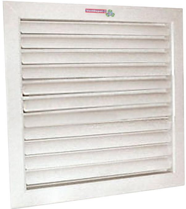
Características Técnicas Específicas de las Rejillas para Aire o Rejillas de Paso de Aire, RetroFlow

Las RetroFlow cuentan con 1 año de garantía sujeto a cláusulas.