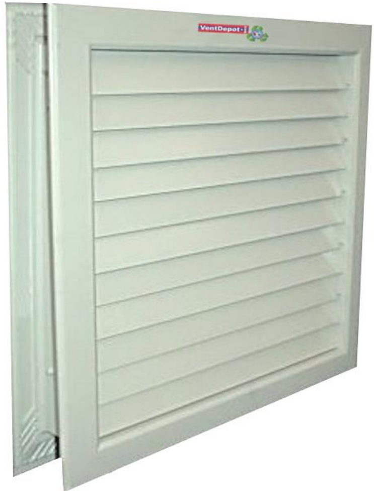
Características Técnicas Específicas de las Rejillas para Aire o Rejillas de Paso de Aire, RetroBlind.

La RetroBlind cuenta con 1 año de garantía sujeto a cláusulas.