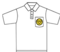
1. Put patches on your cloth. (Embroidery side up!)