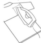
4. Iron inside of garment Underneath patch 30"