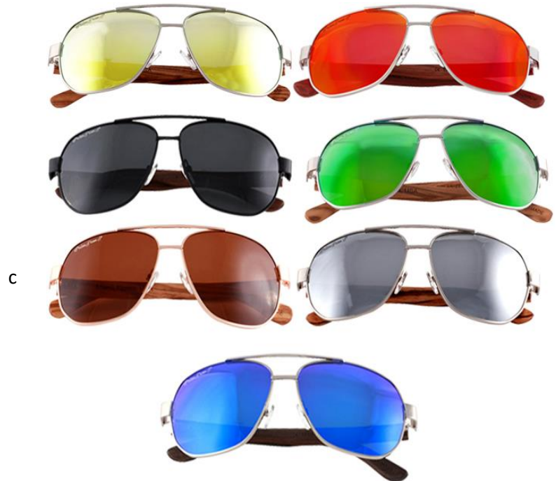
Características Técnicas Específicas de las Gafas para Sol Polarizadas, Fierce Polarized

Las Gafas Fierce Polarized de PalmTree, cuentan con 30 días de garantía sujetos a cláusulas de PalmTree.