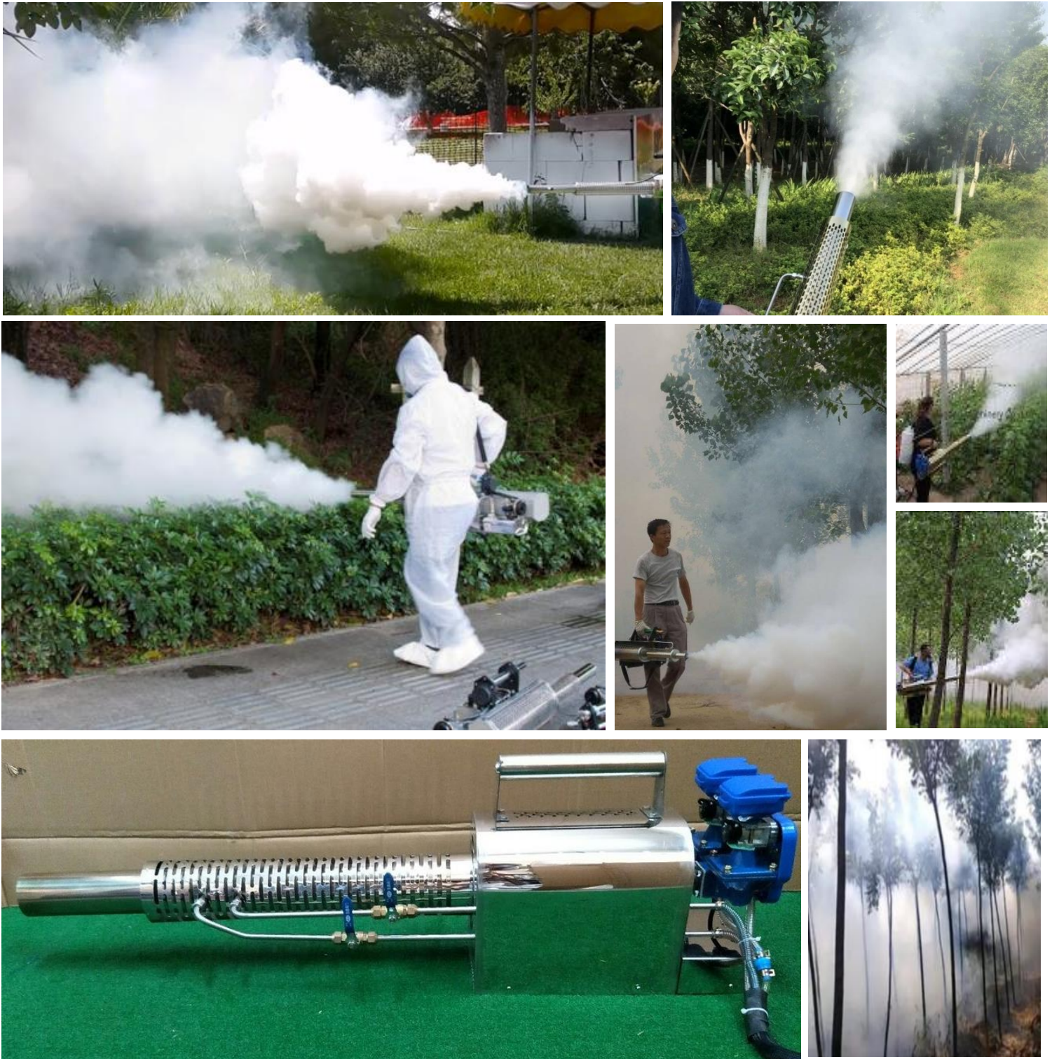
Galería de la Máquina Pulverizadora y Nebulizadora Térmica, NebuliPort.