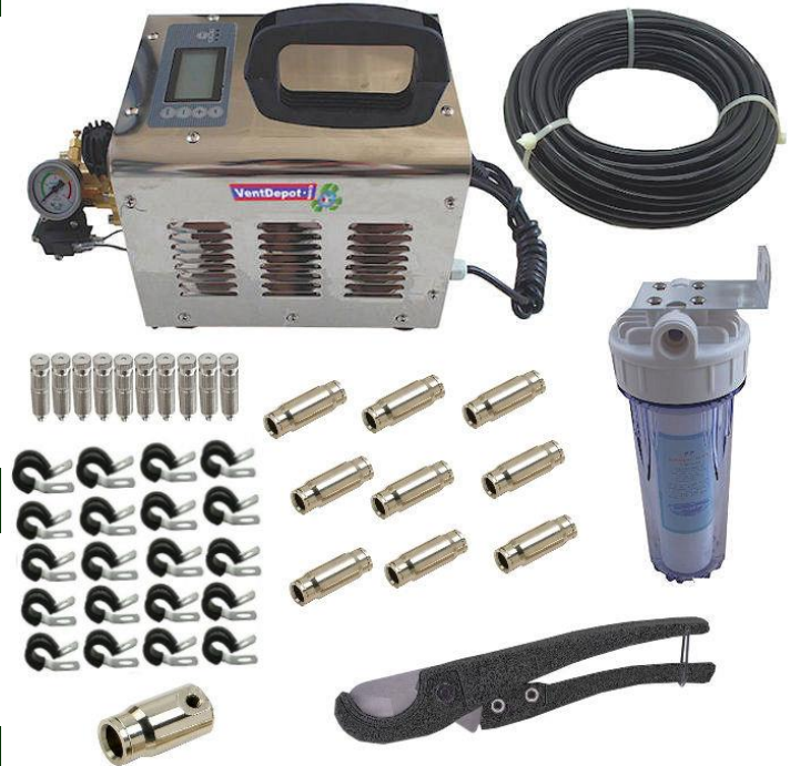
Características Específicas de Nebulización: Kits de Bomba de Alta Presión y Nebulizador PressNebulizer

La garantía de PressNebulizer es de un 1 año certificado por escrito, sujeto a las cláusulas de garantía de VentDepot.