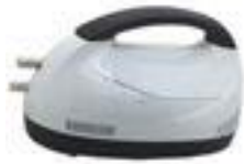
Bomba de Agua