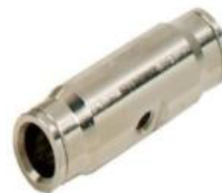
Unión de bloqueo deslizante con una boquilla