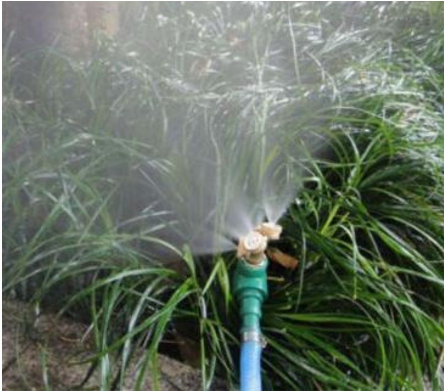
Galería de las Boquillas de Baja Presión, NozzlesThree.