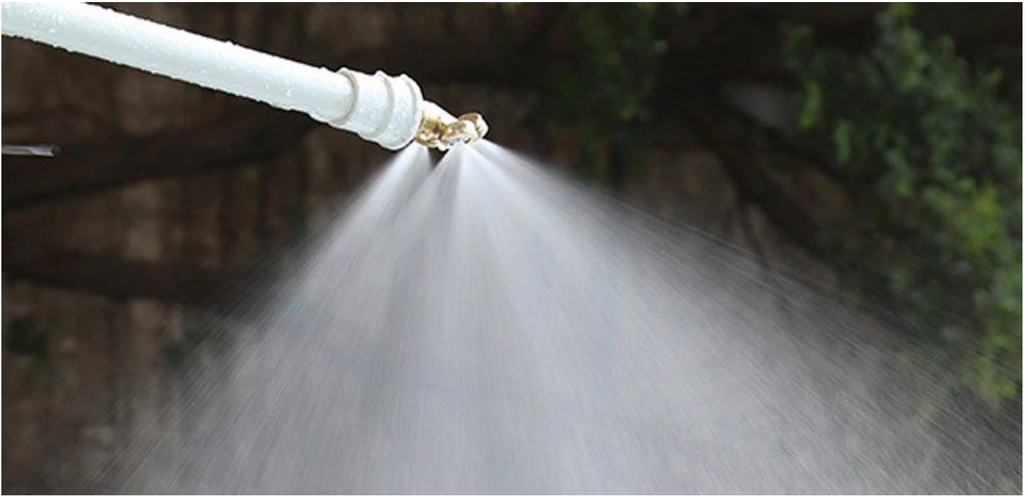
Galería de las Boquillas de Baja Presión , NozzlesThree.