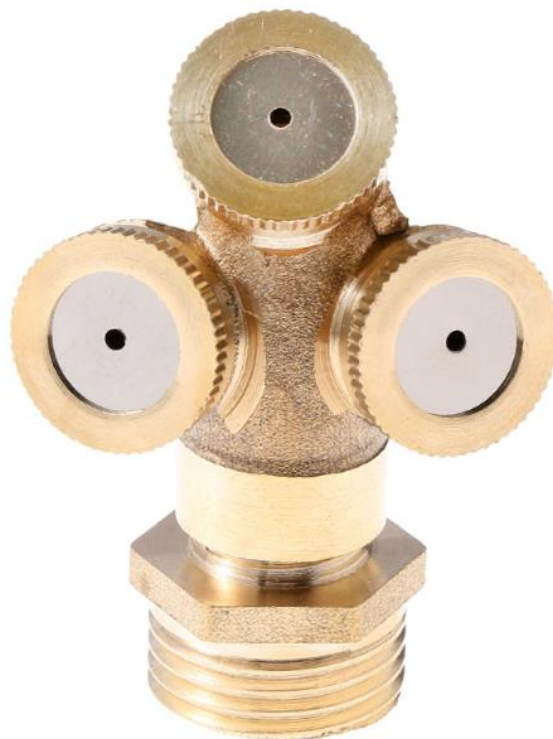
Características Técnicas Específicas de las Boquillas de Baja Presión, NozzlesThree.

El NozzlesThree, cuenta con 1 año de garantía sujeto a cláusulas de VentDepot.