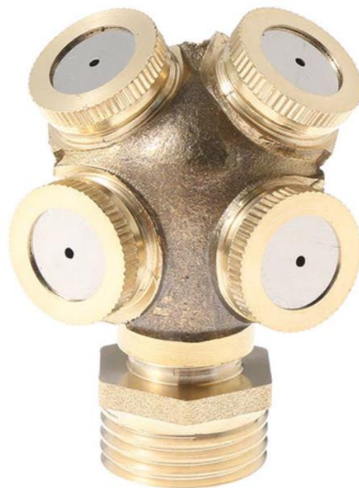
Características Técnicas Específicas de las Boquillas de Baja Presión, NozzlesFour.

El NozzlesFour, cuenta con 1 año de garantía sujeto a cláusulas de VentDepot.