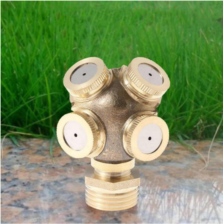
Galería de las Boquillas de Baja Presión , NozzlesFour.