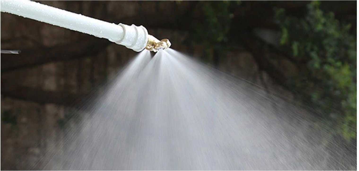
Galería de las Boquillas de Baja Presión, NozzlesFour.