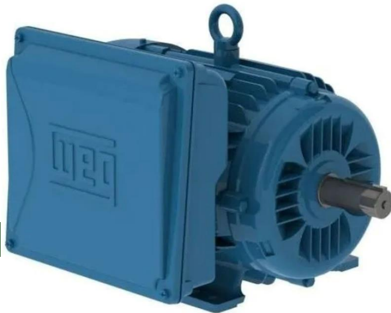
Características Técnicas Específicas de los Motores Monofásicos, BluxMotorC

BluxMotorC tienen 1 año de Garantía por escrito sujeto a las Cláusulas VentDepot.