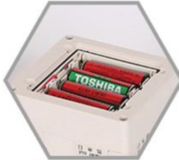
2 Batería DC