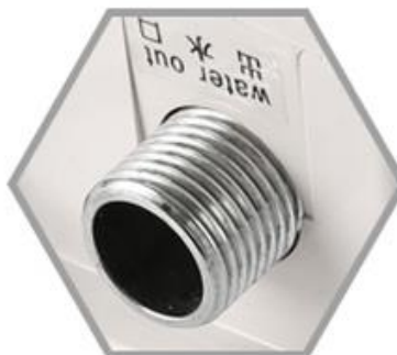
5 Toma de corriente