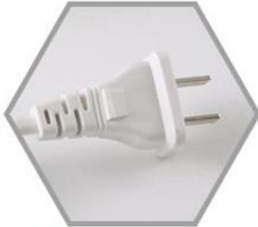
1 Enchufe de CA