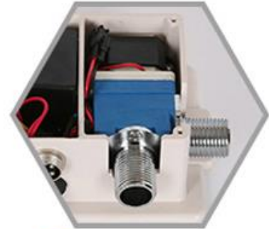
3 Válvula de control