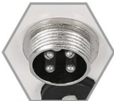
4 Línea sola