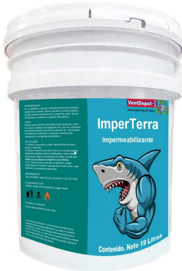
Características Técnicas Específicas del Impermeabilizante, ImperTerra.

El ImperTerra cuenta con 1 año de garantía sujeto a cláusulas de VentDepot.