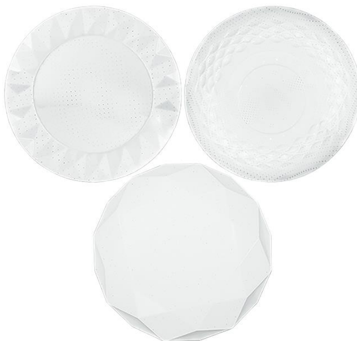
Características Técnicas Específicas de los Luminarios LEDS para Sobreponer, EleganceLight .

Los Luminarios EleganceLight, tienen una garantía de 1 año sujeto a cláusulas VentDepot.