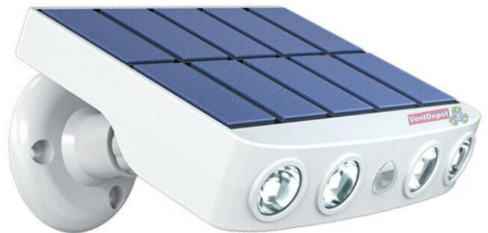
Características Técnicas Específicas del Reflector Solar LED SolarReflect.

El Reflector de LED SolarReflect, tiene una garantía de 1 año certificado por escrito, Sujeto a las Cláusulas de garantía de VentDepot.