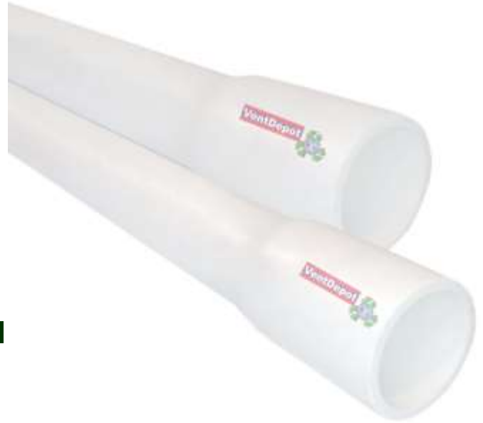
Características Técnicas Específicas del Tubo Hidráulico, HydraTube 40.

El Tubo Industrial de PVC HydraTube 40 tiene una garantía de 1 año certificado por escrito, Sujeto a las cláusulas de VentDepot.