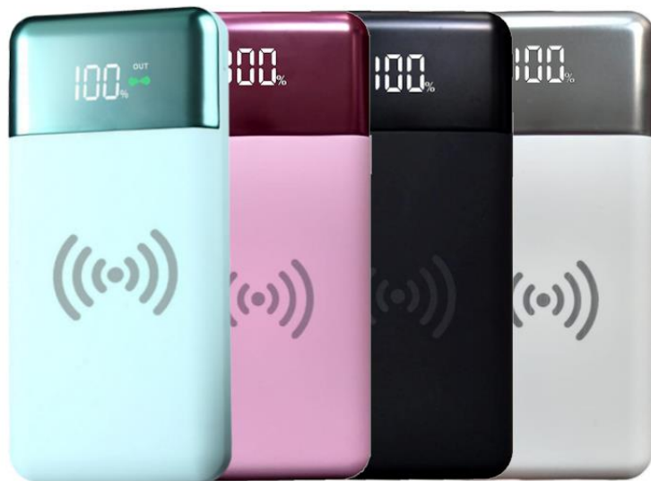
Características Específicas de la Batería portátil, Qi LuxBank.

La Qi Shine, cuenta con 1 año de garantía sujeto a clausulas VentDepot.