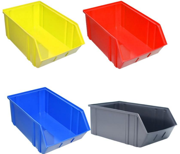
Características Técnicas Específicas de las Gavetas de Plástico DrawerPlast.

Los Contenedores DrawerPlast tienen una garantía de 1 año certificado por escrito, Sujeto a las cláusulas de garantía de VentDepot.