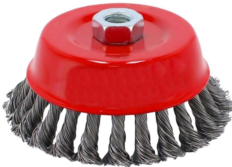
Características Técnicas Específicas de las Cardas de Copa Trenzada, SpinCup

Las Cardas de Copa Trenzada SpinCup tiene una garantía de 1 año certificado por escrito, sujeto a las cláusulas de garantía de VentDepot.