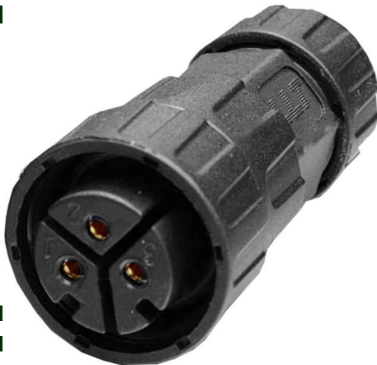
Características Técnicas Específicas del Conector, ConnecPro.

El ConnecPro, cuenta con 1 año de garantía sujeto a cláusulas VentDepot.