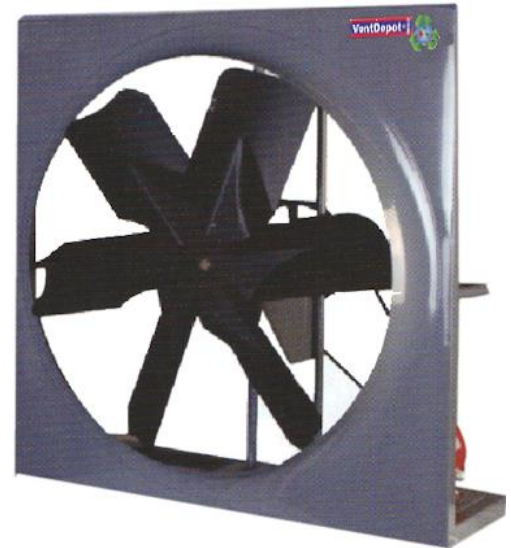
Características Generales del Extractor Axial, AxiBreeze

El BoroCam, cuenta con 1 año de garantía sujeto a clausulas VentDepot.