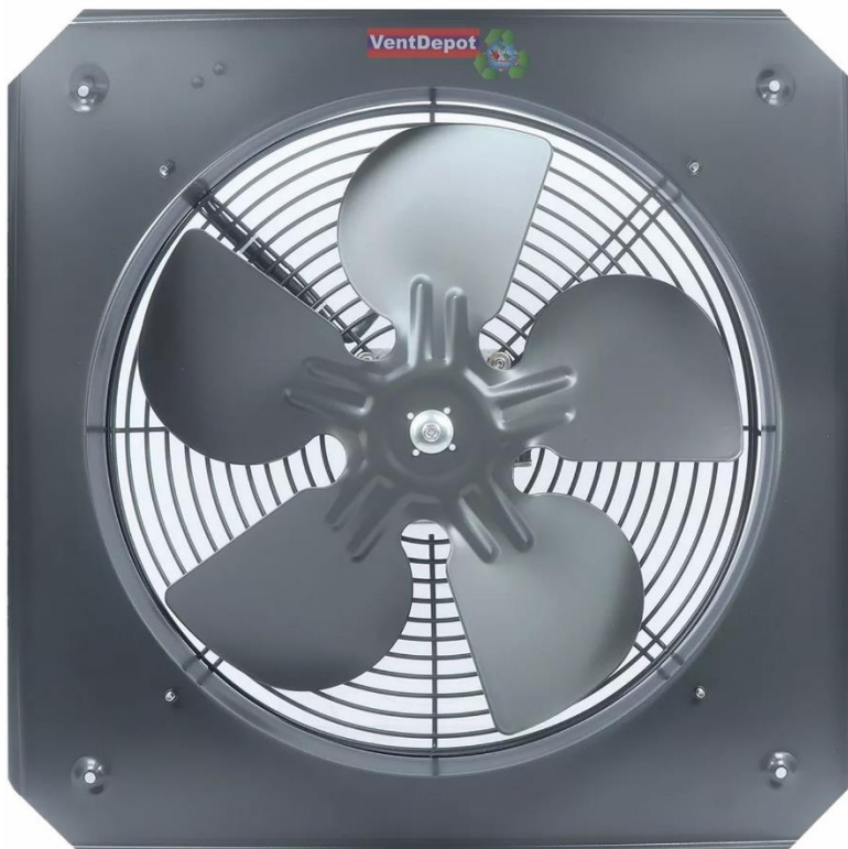
Características Técnicas Especificas de Extractores de Aire para Muro y Pared. AxiAire250.

El AxiAire250 tiene un año de garantía sujeto a cláusulas de VentDepot.