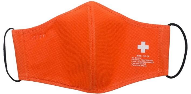
ORANGE / NARANJA