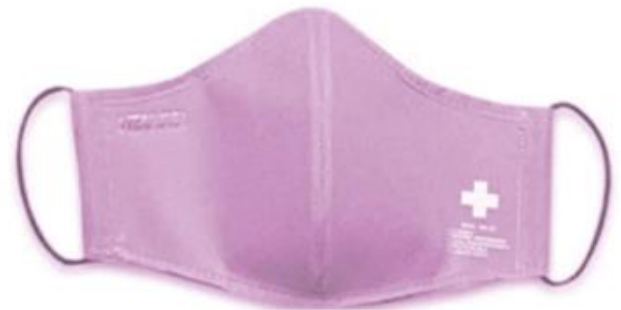
PINK / ROSA