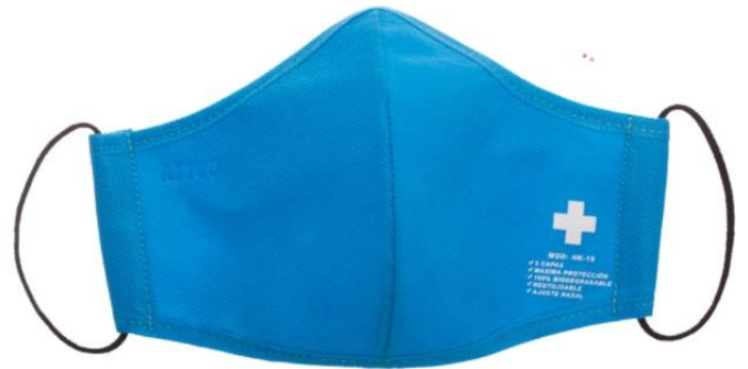
SKY BLUE / AZUL CIELO