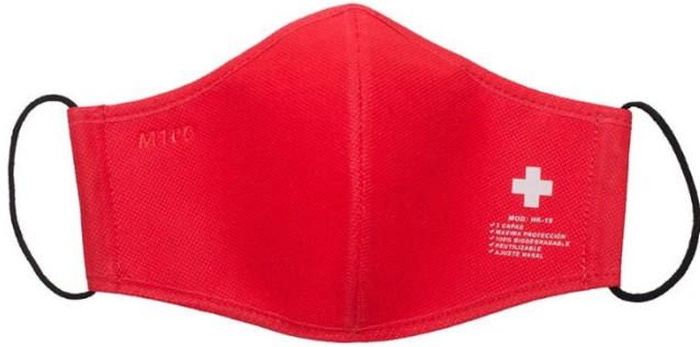
RED / ROJO