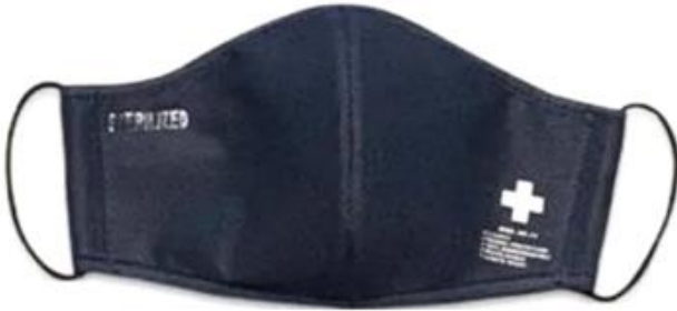
NAVY BLUE / AZUL MARINO