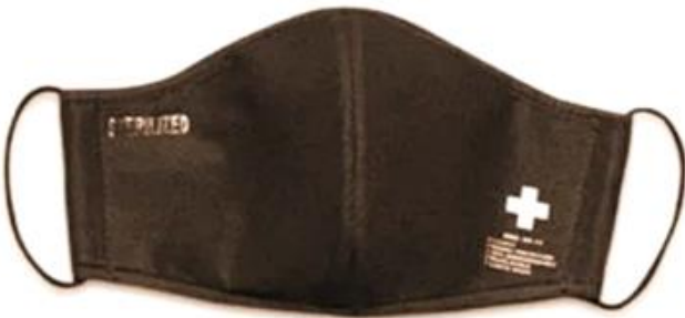
DARK BROWN / MARRON OSCURO