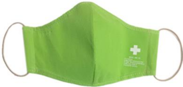
GREEN / VERDE