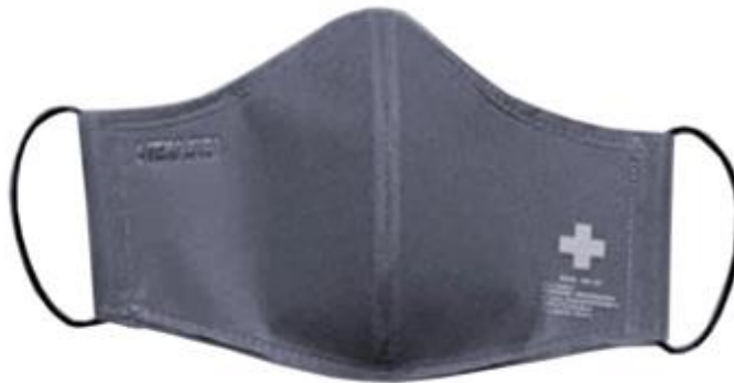
OXFORD GREY / GRIS OXFORD