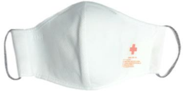
WHITE / BLANCO