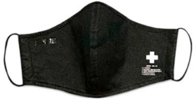
BLACK COAL / NEGRO CARBON