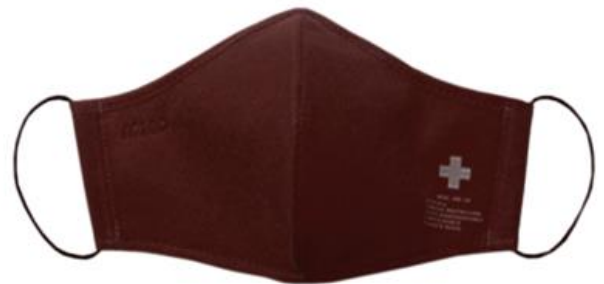
CAME / VINO