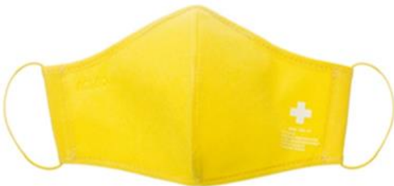
YELLOW / AMARILLO