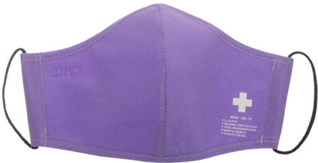
PURPLE / MORADO