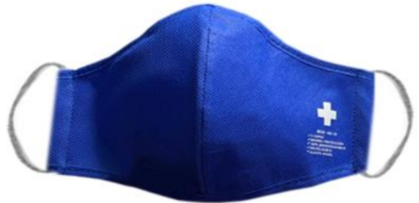
ELECTRIC BLUE / AZUL ELECTRICO