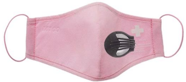
Características Técnicas Específicas de la Careta Protectora para Niños, SafeMask Air.