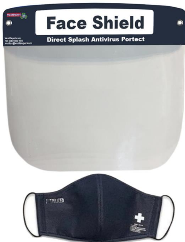
Características Técnicas Específicas de la Careta Protectora, MaskPlash.

El MaskPlash, cuenta con 2 meses de garantía sujeto a cláusulas de VentDepot.