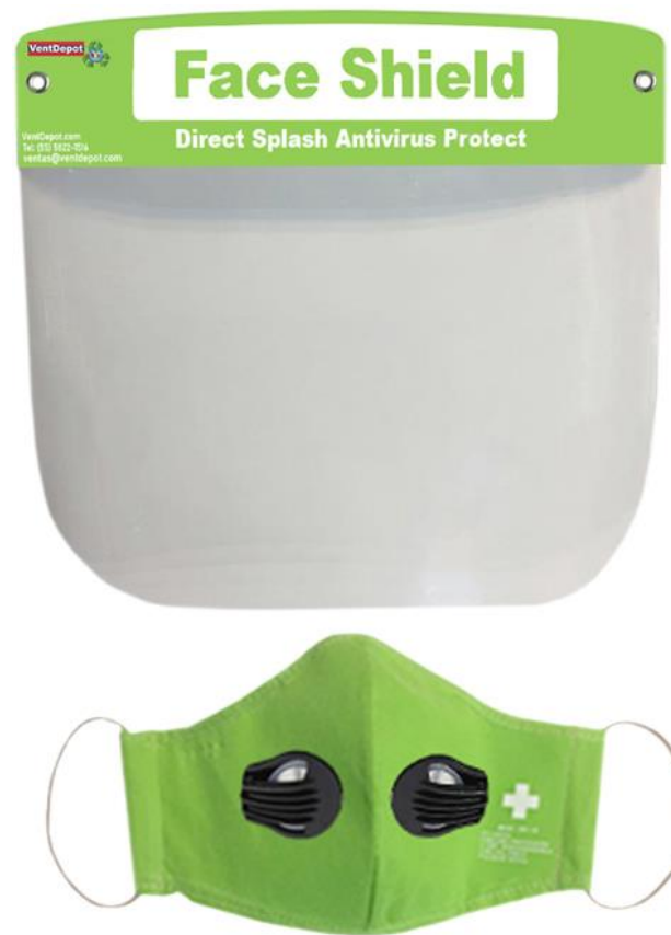
Características Técnicas Específicas de la Careta Protectora, MaskPlash Pro.

El MaskPlash Pro, garantía por defecto de fabricación sujeto a cláusulas VentDepot.