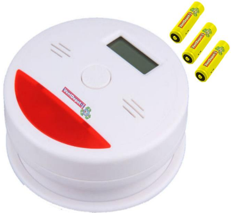
Características Específicas del Detector de Humo, SmokyUltra.

La garantía de SmokyUltra es de un (1) año certificado por escrito, sujeto a las cláusulas de garantía VentDepot.