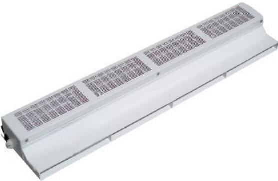
Cortina de Aire CortinHigh