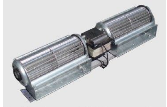
Turbina tangencial doble con motor