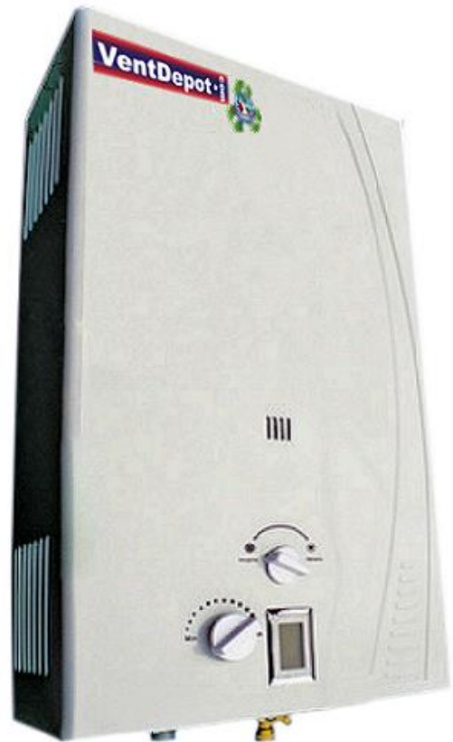
Características Generales de Calentadores de Agua: Instantáneos o de Paso WaterHeater

La Garantía del WaterHeater es de 5 años sujeto a Clausulas de Ventdepot.