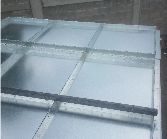
Galería de Imágenes de Cabinas de Pintura Modular Techo Ciego