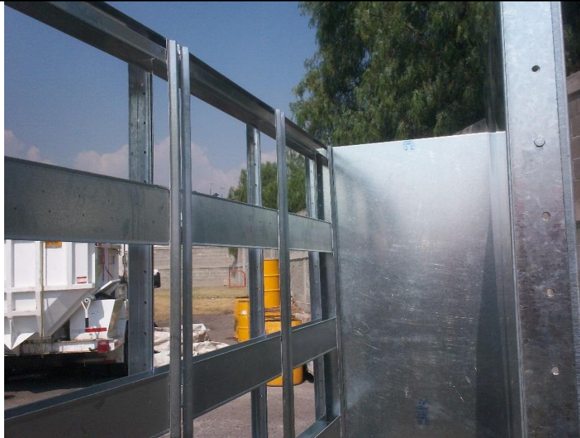
Galería de Imágenes de Cabinas de Pintura Modular Filtro Ingestión Fijos